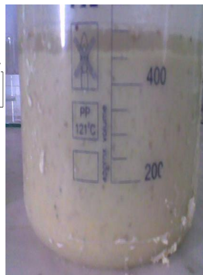
Диспергированная кормовая смесь