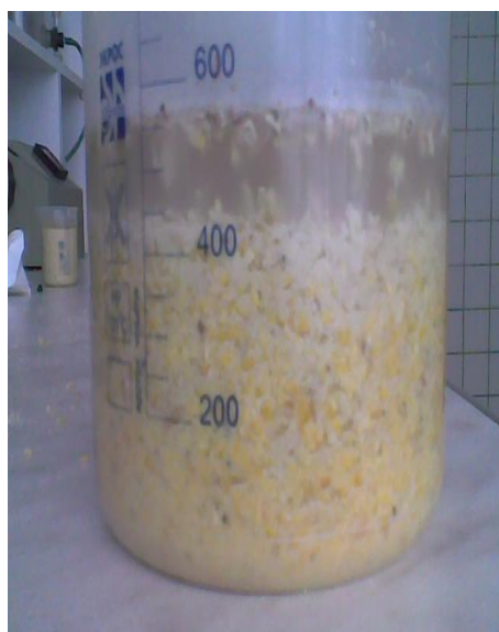
Плющенная кукуруза без обработки